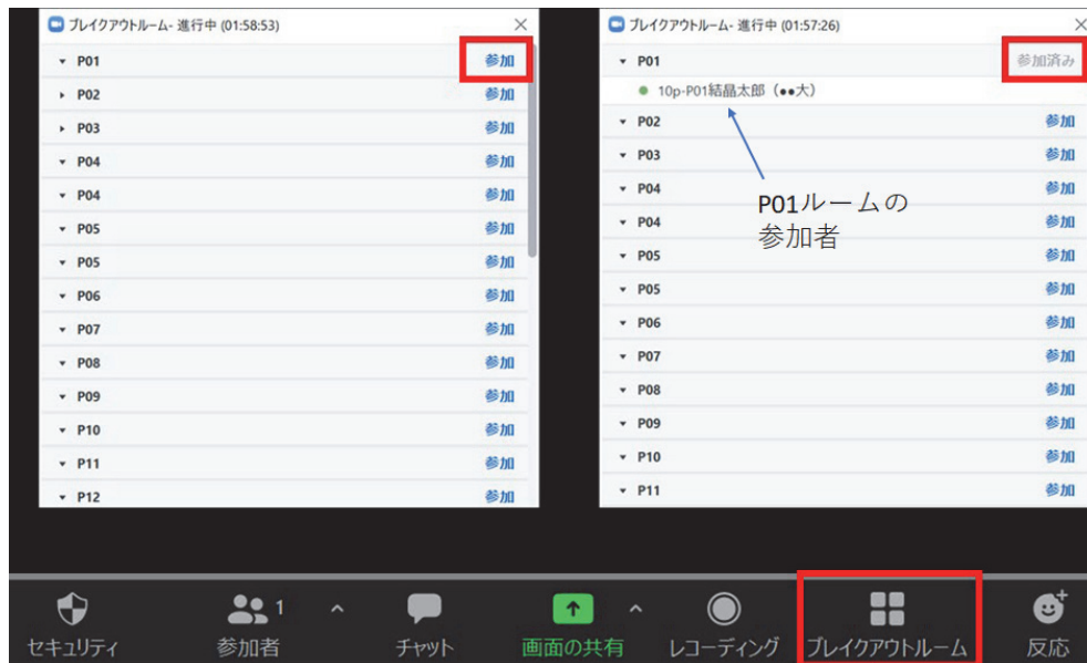
図 1 ブレイクアウトルームの表示画面